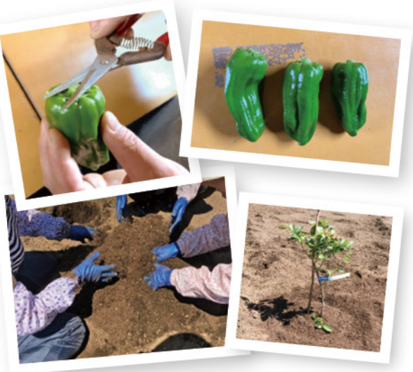
ピーマンのヘタ切り作業、ブルーベリーの苗を植える作業が実現しました！

今年、やませみでも「農福連携」の拡大を目指し、農家さんと福祉事業所とをつなげる活動を行っています。まいりました。