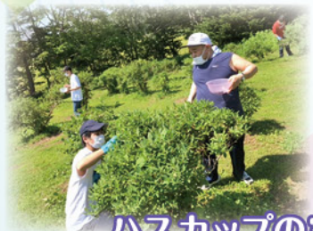
ハスカップの実はどこかな?