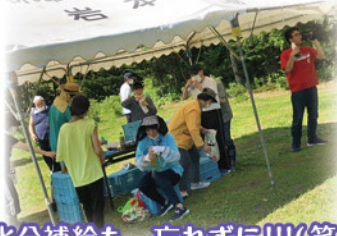
水分補給も、忘れずに!!!(笑)