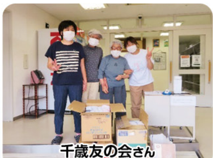
千歳友の会さん “ぞうきん” ありがとうございます