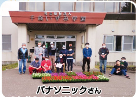
パナソニックさん “お花” ありがとうございます